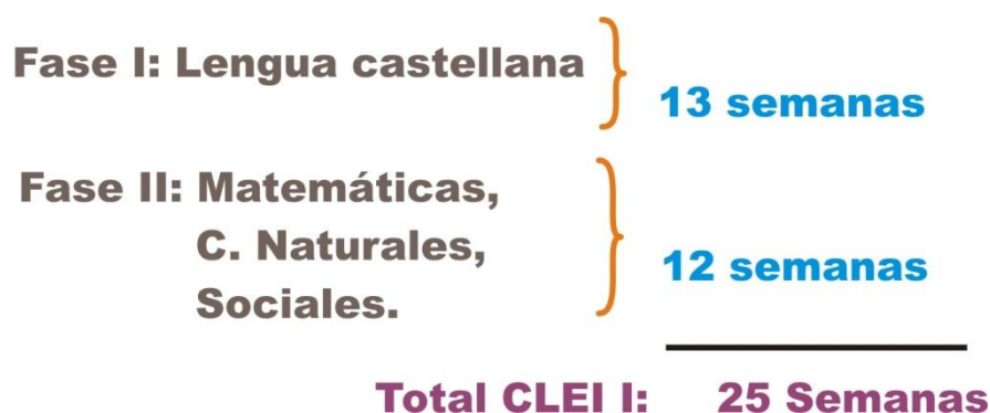
Gráfica 4. Áreas de aprendizaje que demanda adquirir el joven y adulto en el PAVA, y tiempo estimado por cada fase.

Para llegar a esa meta, se formuló un modelo pedagógico (andragógico) fundamentado en dos líneas pedagógicas modernas Inteligencias múltiples y aprendizajes significativos. De este planteamiento pedagógico se plantea una programación académica por fases para ser ejecutada en un periodo de 25 semanas y estimadas en 230 horas. En la primera fase el estudiante cursa elementos básicos de lengua castellana y durante 13 semanas.; la segunda fase , adquiere conocimientos, habilidades y destrezas en matemáticas, ciencias naturales y sociales, en un periodo de 12 semanas (gráfica 4):